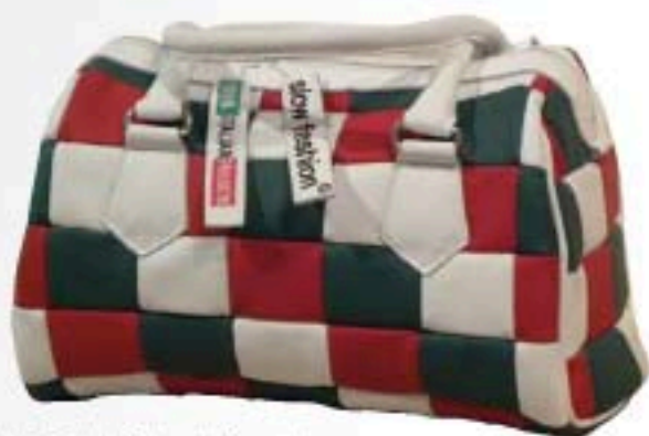
Borsa Italia Tricolore - Federmoda Piemonte

Per celebrare l'importante anniversario del Paese è gadget mania: prodotti in serie limitata che diventeranno oggetti da collezione