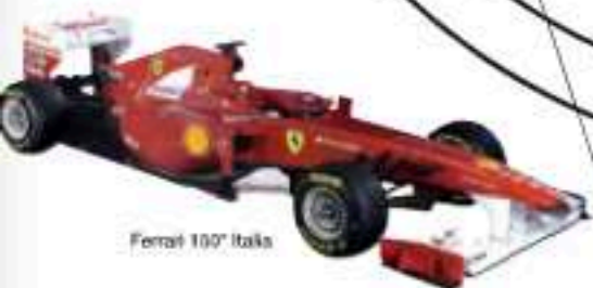
Ferrari 100 o Italia