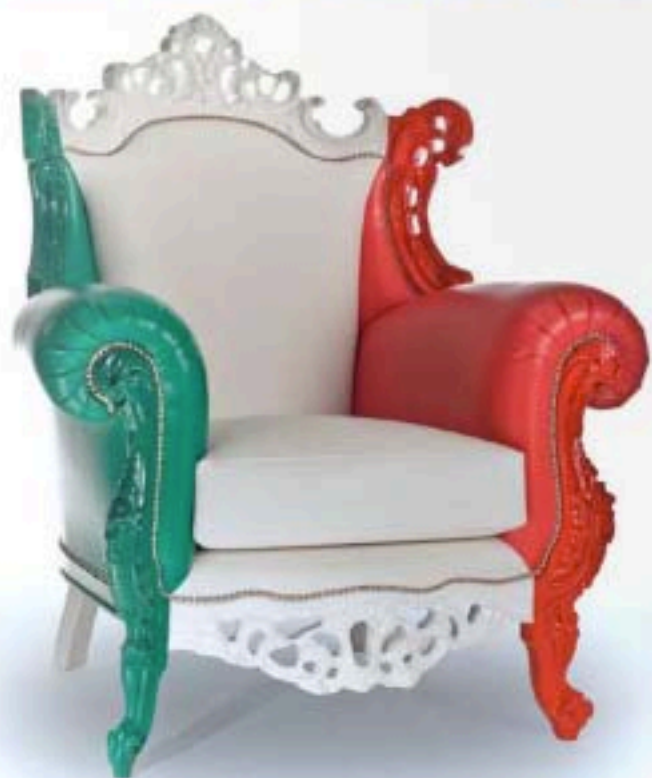
Poltone by MODENESE GASTONE realizzata in serie limitata