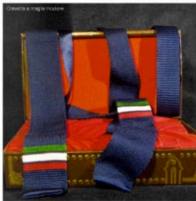
Cravatta a maglia tricolore

Per celebrare l'importante anniversario del Paese è gadget mania: prodotti in serie limitata che diventeranno oggetti da collezione